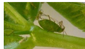
Puceron du pois Acyrtosiphon pisum

Le laboratoire BF2i est une Unité Mixte de Recherche (UMR) associant l'INRA et l'INSA de Lyon. Les recherches menées dans cette unité sont centrées sur l'étude du fonctionnement des insectes ravageurs aux niveaux génétique et physiologique, et portent sur l'analyse des interactions complexes qu'ils entretiennent avec leur environnement (plantes, bactéries symbiotiques, insectes prédateurs ou parasitoïdes). Les objectifs finalisés des recherches de l'unité sont le développement de pratiques agronomiques durables et respectueuses de la santé humaine et des agroécosystèmes.