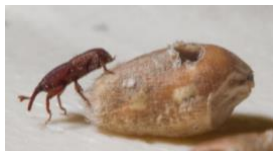
Charançon des céréales Sitophilus oryzae

Pour arriver à ses fins, le laboratoire BF2i dispose ainsi de deux insectes ravageurs modèles: le puceron du pois Acyrtosiphon pisum et le charançon des céréales du genre Sitophilus et de lignées cellulaires d'insectes Sf9. Ce matériel permet de tester in vivo et in vitro l'activité insecticide des peptides d'intérêt des membres du GDR qui le souhaitent.